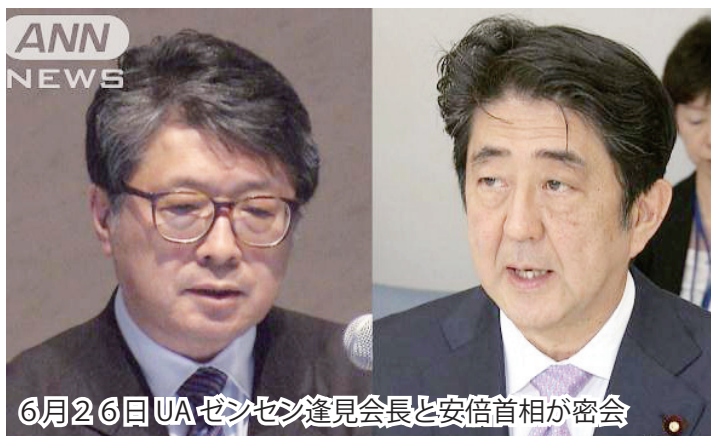
6月26日 UAゼンセン逢見会長と安倍首相が密会