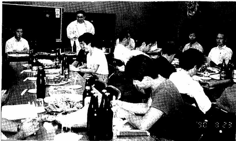
日頃の労をねぎらい、運動の前進を確認!

九〇年夏季物販運動は、「四、一」をのりこえた清算事業団闘争の高揚と、動労千葉三、一八前倒しストへの不当処分策動との対決の中、全組合員の力を結集し、闘争との結合を貫徹しぬいた事が、夏季物販の成功を勝ちとったことを全体で確認することが出来る。