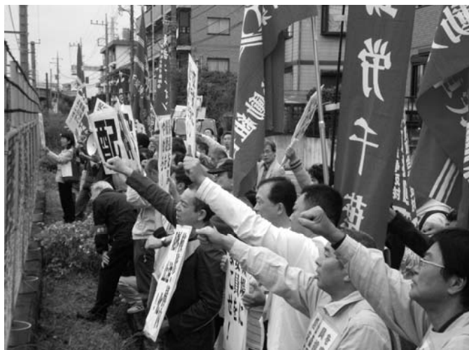
10・1 幕張車両センターで、不当配転に抗議し、 ストライキに立ち上がった動労千葉

車両検修業務外注化阻止！ ライフサイクル制度白紙撤回！ J R - 事故調による尼崎事故隠ぺい工作弾劾！ 運転保安確立！ 派遣法撤廃！ 道州制 - 公務員労働者 360 万人首切り攻撃粉碎！