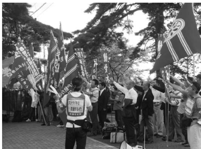
9・14 J R 研修センターで、不当配転に抗議し、 ストライキに立ち上がった動労水戸